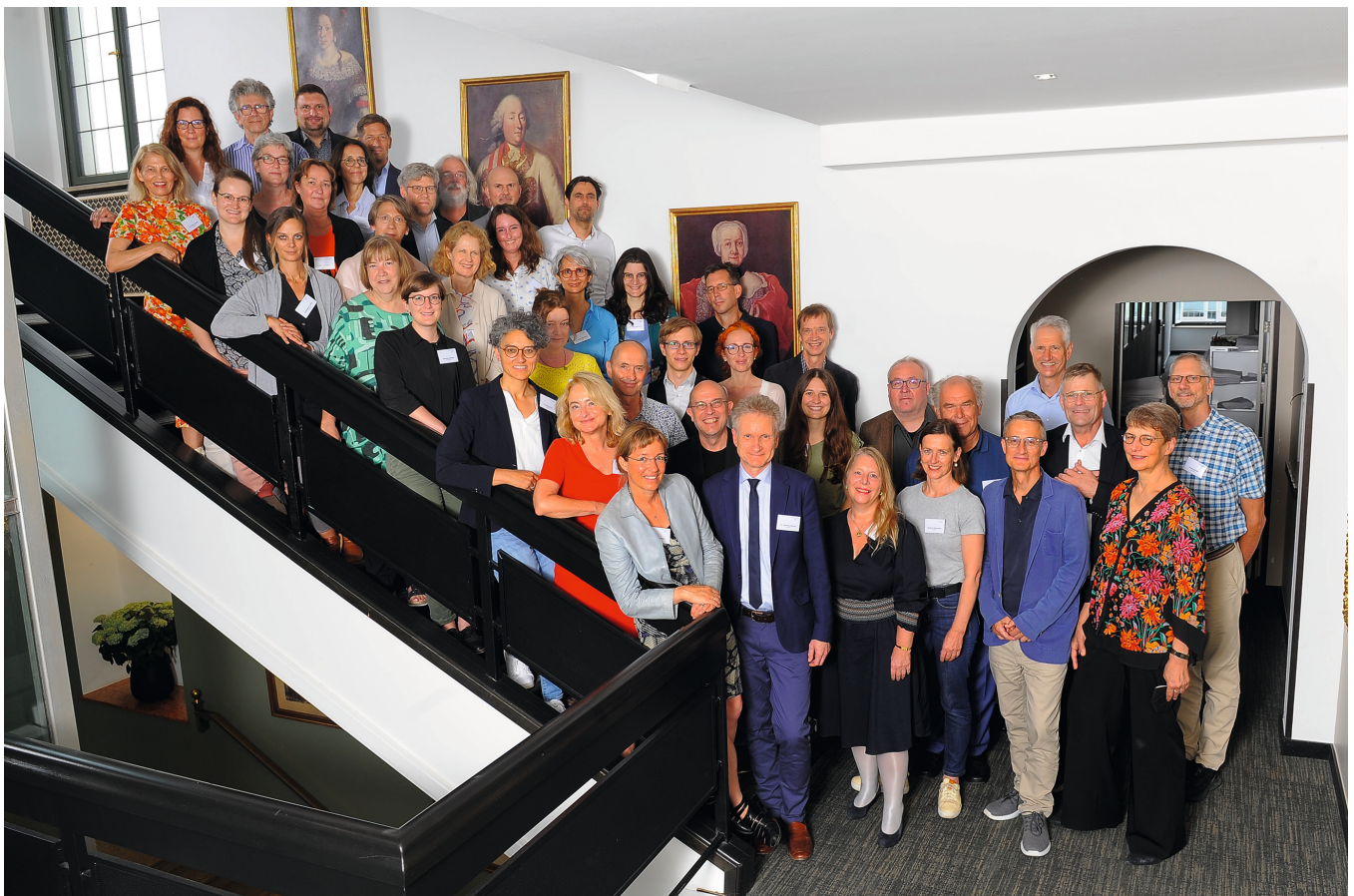
Die Delegiertenversammlung wurde im Frühjahr 2022 gewählt und trat zur 41. DV erstmals in Präsenz zusammen.